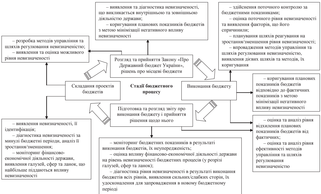
Рис. 3. Заходи щодо регулювання рівня невизначеності на стадіях бюджетного процесу

роки, тобто спостерігається ситуація, що відповідає фінансовій рецесії.