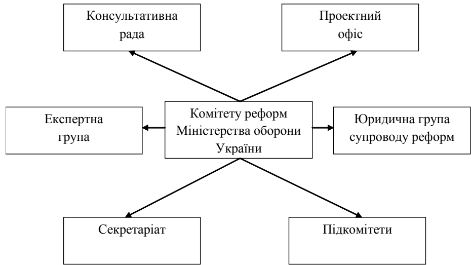
Рис. 1. Структура Комітету реформ Міністерства оборони України

Зокрема в межах засідання Комітету було здійснено обговорення конкретних заходів щодо реалізації дорожньої карти реформування оборонного відомства. Так, до 2018 року планується завершення реформування Міністерства Оборони України та Генерального Штабу Збройних Сил України. Відповідно, до 2018 року 90% підрозділів повинні відповідати стандартам НАТО і повністю має бути завершено реформування оперативного та повітряного командування. До 2020 року планується