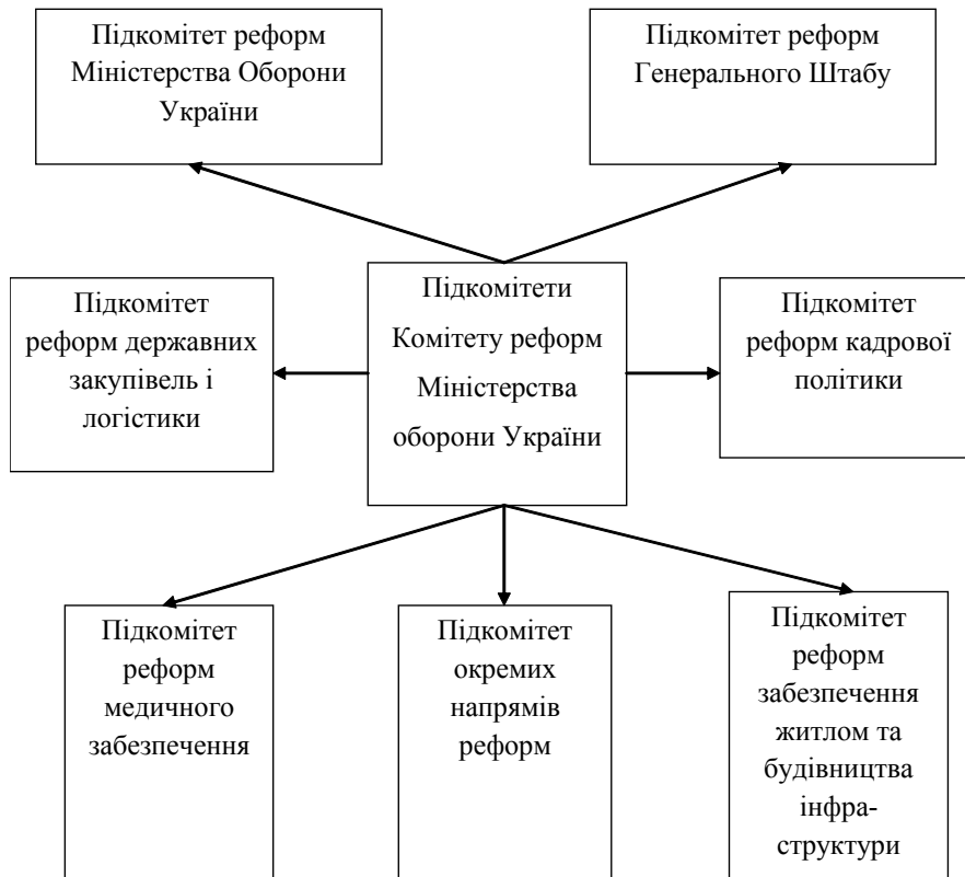
Рис. 2. Підкомітети Комітету реформ Міністерства оборони України