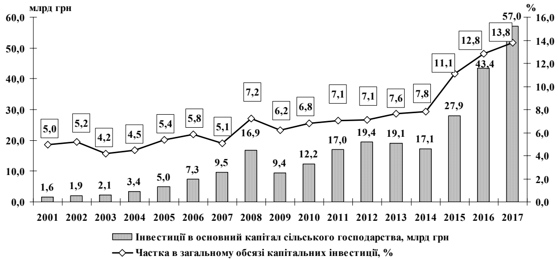
Рис. 1. Інвестиції в основний капітал сільського господарства та їх частка в загальному обсязі капітальних інвестицій в цілому по Україні