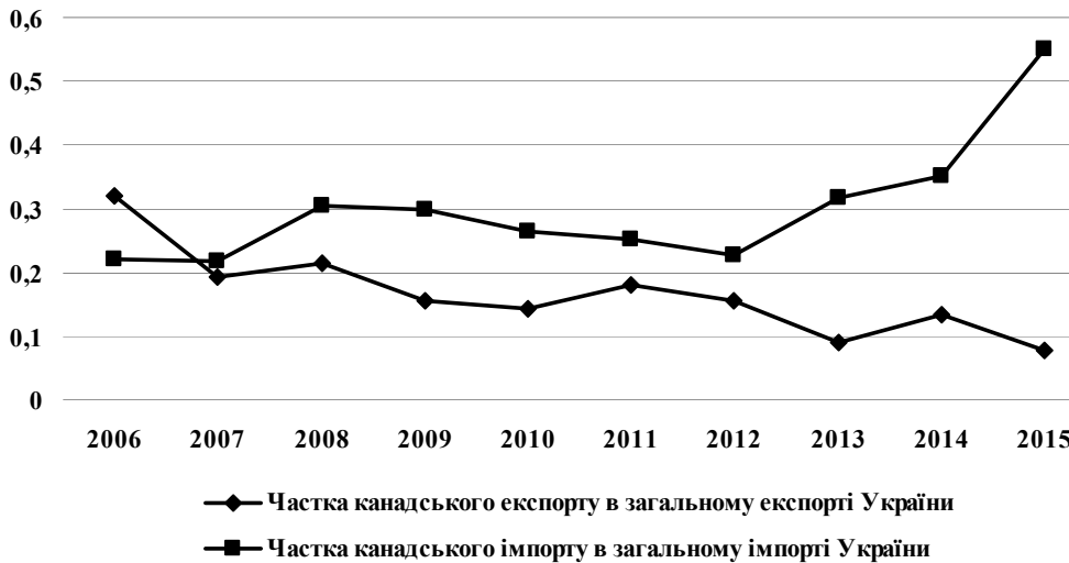
Рис. 1. Частка канадського експорту-імпорту в експортно-імпортній структурі України, %

стання було повільним і прогноз на найближчі кілька років передбачає подальше повільне економічне зростання через очікуване уповільнення економіки США, а також слабкі місця організаційної структури Мексики. Мексика є одним з найбільш важливих торгових партнерів США, займаючи друге місце серед експортних ринків США, а також третє місце в загальному обсязі торгівлі США (експорт плюс імпорт). У рамках НАФТА, США і Мексика розробили значні економічні зв'язки. Торговля між двома країнами збільшилась більш, ніж в три рази з моменту набуття чинності угоди в 1994 році. Мексика посідає друге місце за величиною економіки в Латинській Америці, після Бразилії. Населення становить 124 млн осіб, що робить її найбільш густонаселеною іспаномовною країною в світі [19].