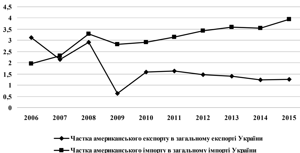
Рис. 2. Частка американського експорту-імпорту в експортно-імпортній структурі України, %

Однак український експорт товарів до Канади за 8