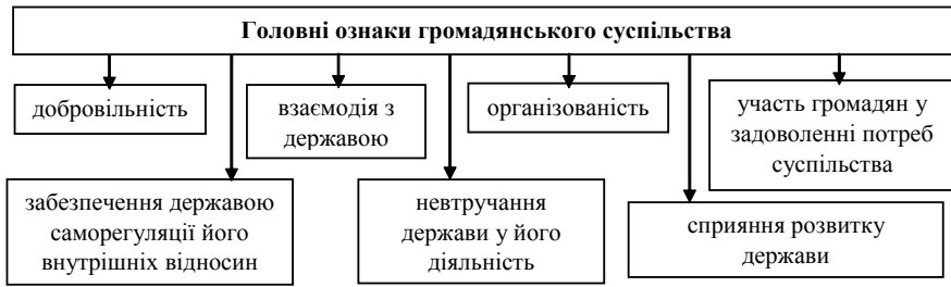
Рис. 1. Головні ознаки громадянського суспільства

Джерело: сформовано на основі джерела: [6, с. 142].