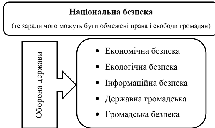
Рис. 1. Конституційні складові національної безпеки

тного формування державної політики в економічній сфері загалом" [2].