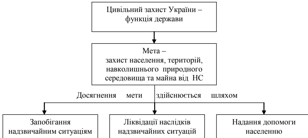
Рис. 1. Загальна схема визначення цивільного захисту України

наш погляд, необхідно визначитися із сутністю понять, "держава", "функції держави", "цивільний захист" та його місцем і роллю у загальній системі безпеки держави.