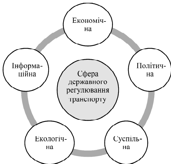
Рис. 1. Види сфер державного регулювання транспортної галузі