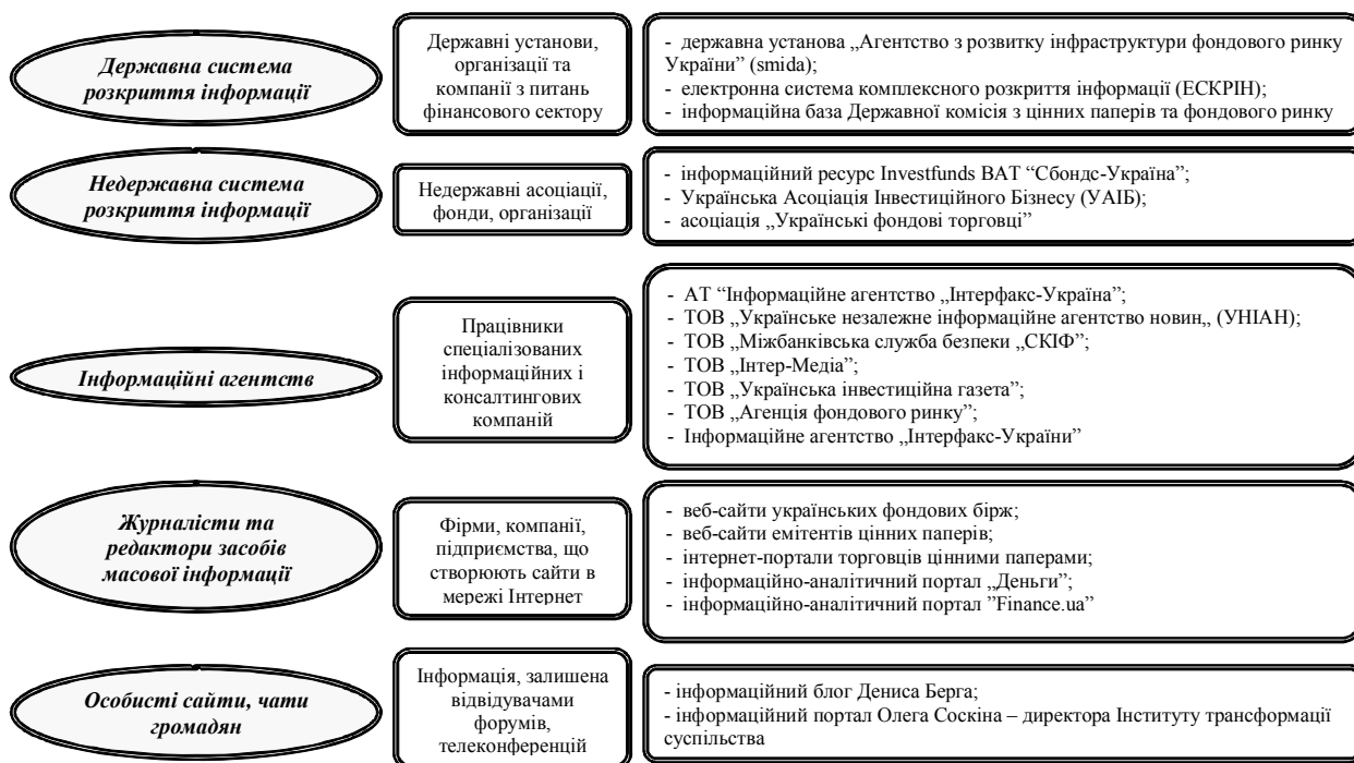
Рис. 2 Класифікація джерел інформації з питань цінних паперів та фондового ринку