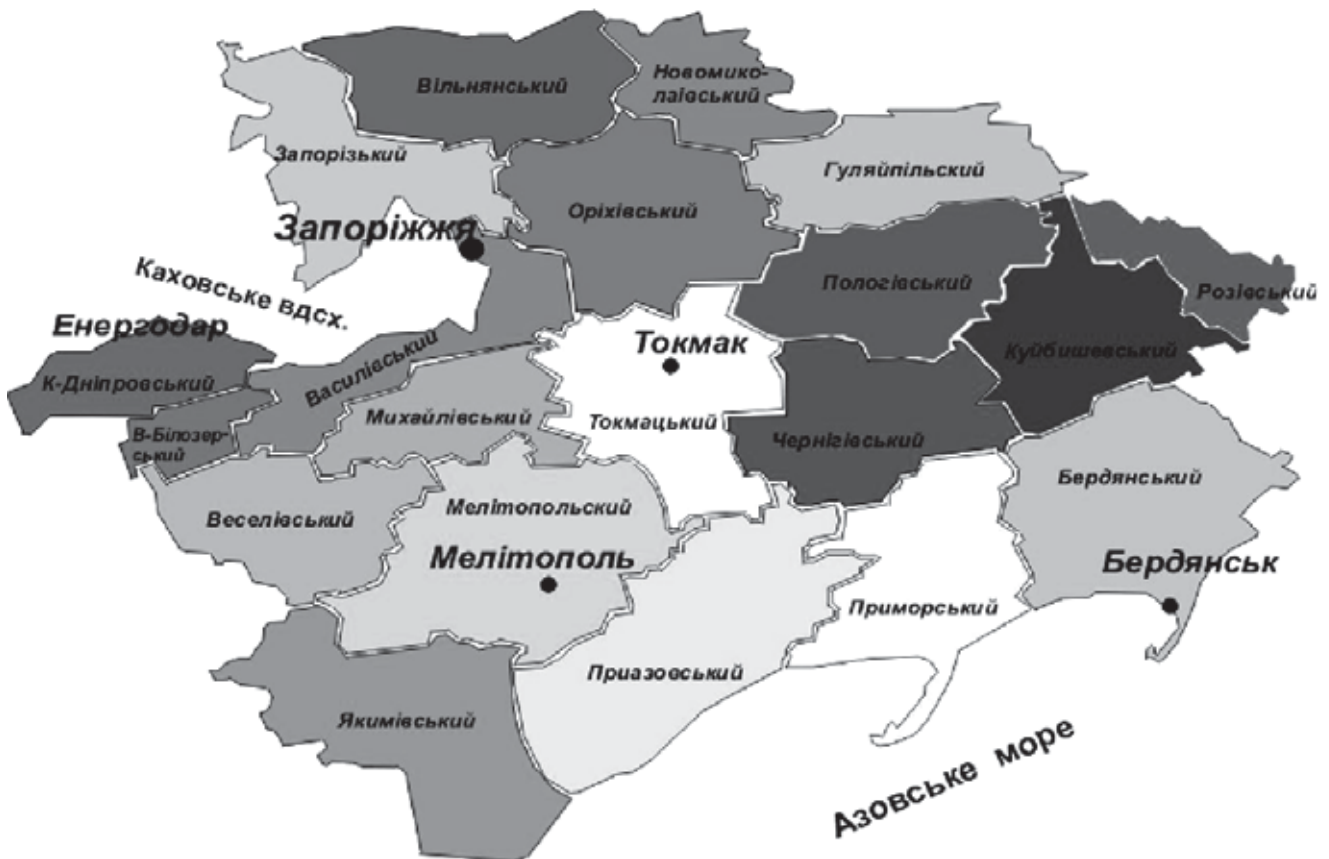
Рис. 2. Сфера діяльності Запорізького НВ АПО, що пропонується на III етапі його створення та розвитку

5) допомога в проведенні реорганізації і реструктуризації підприємств;