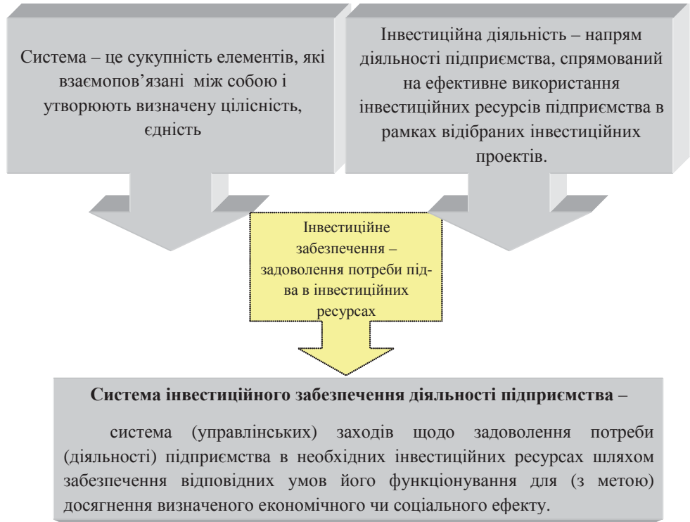
Рис. 1. Сутність інвестиційного забезпечення діяльності підприємства [розроблено автором]

Ресурсні підходи роблять акцент на стратегіях використання існуючих, специфічних відносно підприємства активів [3], результатом чого є специфічний ресурсний набір. Тут доцільно звернути увагу, що окремі ресурси, складові набору, створюють цінність для підприємства на даний момент, інші можуть створити таку цінність у майбутньому за певних обставин. Необхідно диференціювати із загальної множини економічних ресурсів такі, що володіють інвестиційними характеристиками.