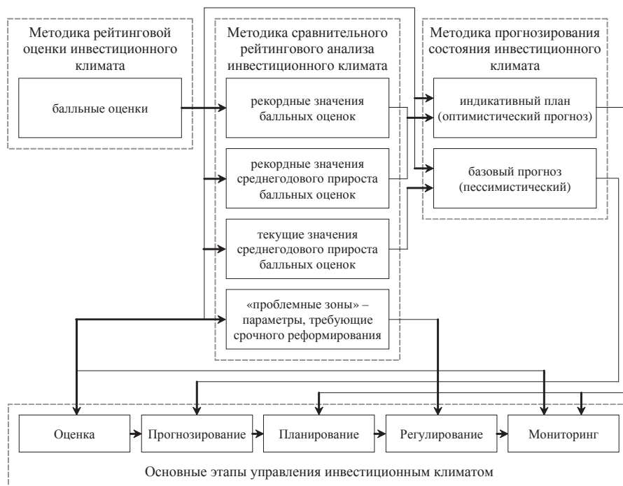
Рис. 1. Информационно-методическое обеспечение основных этапов процесса управления инвестиционным климатом государства