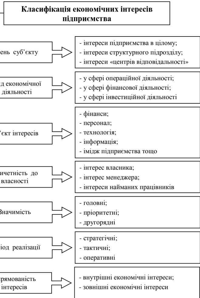
Рис. 1. Класифікація економічних інтересів підприємства

Метою статті є дослідження особливостей захисту економічних інтересів малого підприємництва на різних стадіях життєвого циклу функціонування бізнесу, розгляд взаємозв'язку економічних потреб та інтересів в розрізі складових економічної безпеки підприємства.