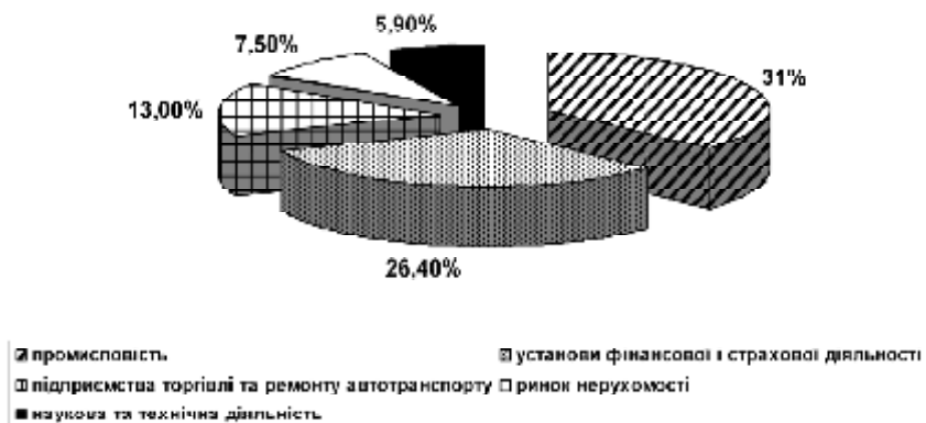
Рис. 4. Структура прямих іноземних інвестицій в Україну за галузями економіки

У статті доведено, що в умовах кризи та обмеженості інвестиційних ресурсів в країні, формування державної інвестиційної політики може мати за підґрунтя концепцію сталого розвитку. Відповідно до Рамкових основ інвестиційної політики з метою сталого розвитку