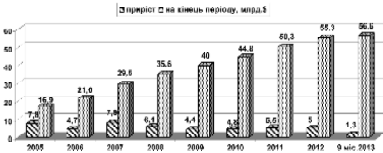
Рис. 3. Обсяг прямих іноземних інвестицій в Україну, млрд дол. США