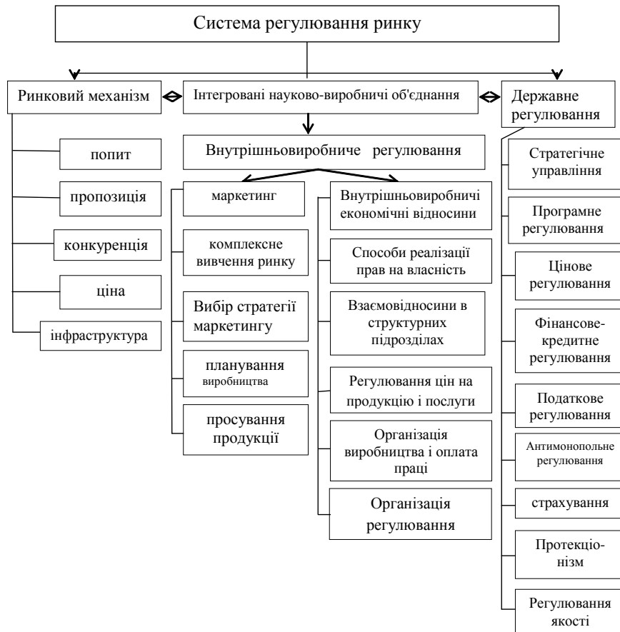
Рис. 2. Складові системи регулювання ринку аграрної продукції