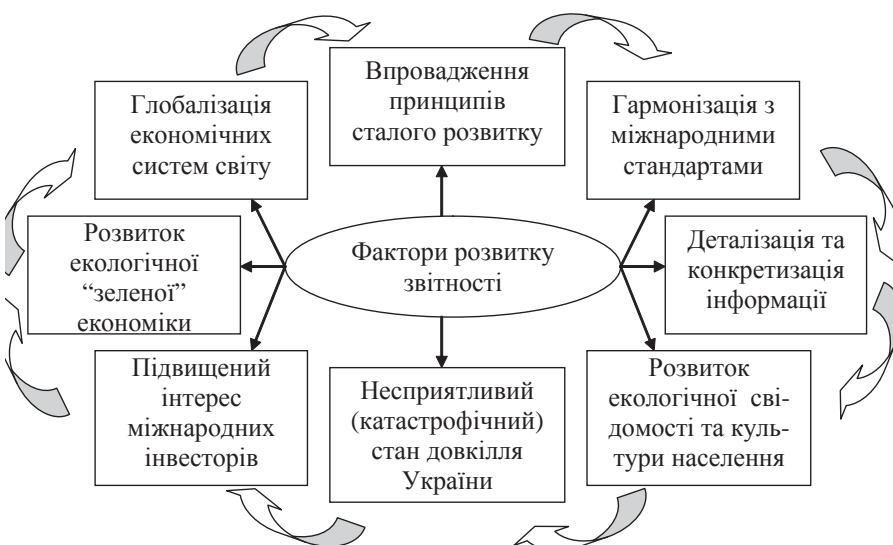
Рис. 2. Система факторів впливу на розвиток та удосконалення статистичної звітності в частині природних ресурсів та охорони навколишнього середовища

нього середовища [6, с. 138]. Маючи на меті підвищення якості та корисності звітності в сфері сталого розвитку, Коаліцією було визначено фактори розвитку та удосконалення формування екологічних статистичних звітних документів. До них віднесено наступні (рис. 2).