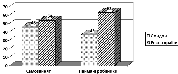
Рис. 3. Співвідношення іноземних громадян в Сполученому Королівстві за типами зайнятості, 2011 р., (у %) (складено на основі [2])

ся мігранти з колишніх колоній, хоча поступово зростає і роль представників Центральної та Східної Європи, які отримали можливість вільного їзду на територію Британії після розширення ЄС у 2004 р. та 2007 рр. Важливу роль при відборі мігрантів відіграє Система балів, яка дозволяє зробити механізм відбору необхідних для країни іммігрантів більш ефективним.