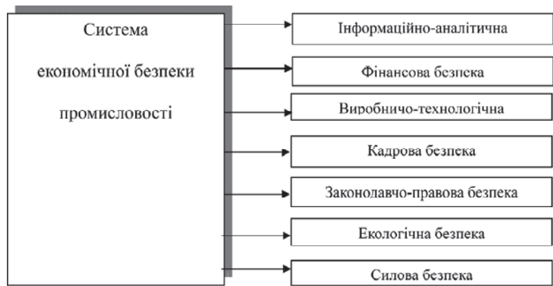
Рис. 2. Складові економічної безпеки промисловості

Серед сфер виробничо-господарської діяльності, що забезпечують достатній рівень економічної безпеки, слід визначити конститутивно-ключові, наприклад: техніко-економічну, ресурсну, фінансову, інтелектуальну та кадрову складові, інформаційну безпеку та соціальну. Наведено загальну схему головних складових економічної безпеки (рис. 1).