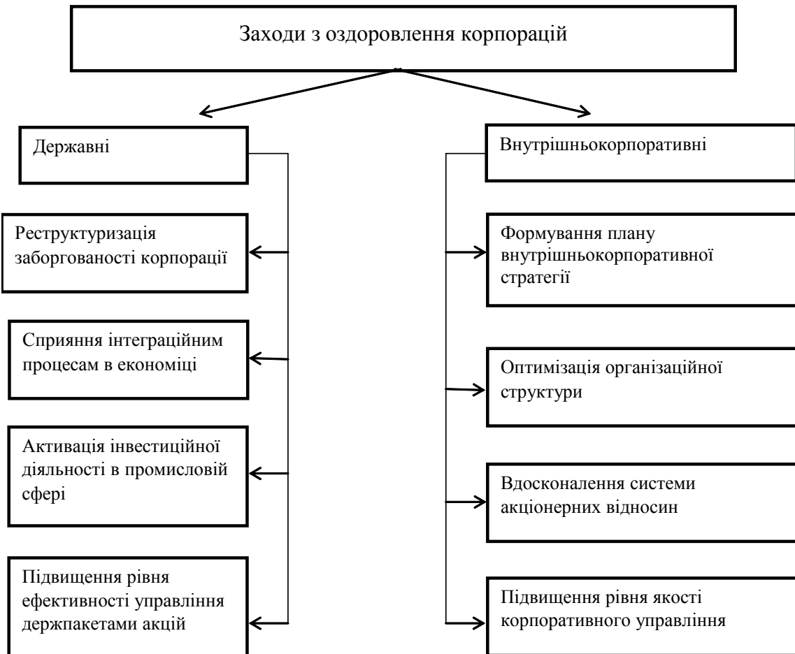
Рис. 2. Заходи з оздоровлення корпорацій

Що стосується класифікації транснаціональних корпорацій, то в сучасній економічній літературі