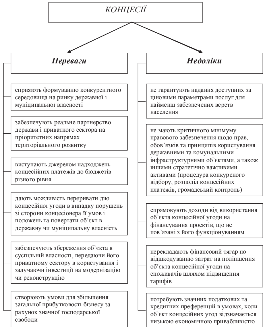
Рис. 1. Переваги та недоліки концесій

Інституціональне оформлення використання механізму концесійних відносин в інфраструктурних галузях економіки надає державі додаткові можливості для ефективного фінансування та управління об'єктами соціально-економічної інфраструктури, а приватним інвесторам — новий механізм реалізації інвестиційних проєктів. Внаслідок реалізації інтересів суб'єктів такого державно-приватного партнерства в інфраструктурі виникає значний економічний та соціальний ефект, які проявляються у збільшенні обсягів залучених прямих внутрішніх і зовнішніх інвестицій; прискоренні темпів