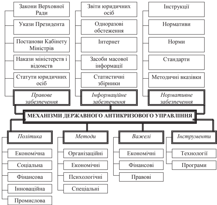
Рис. 2. Структура механізмів здійснення державної політики розвитку інноваційного потенціалу на основі антикризового управління

Розглядаючи структуру механізмів здійснення держав-