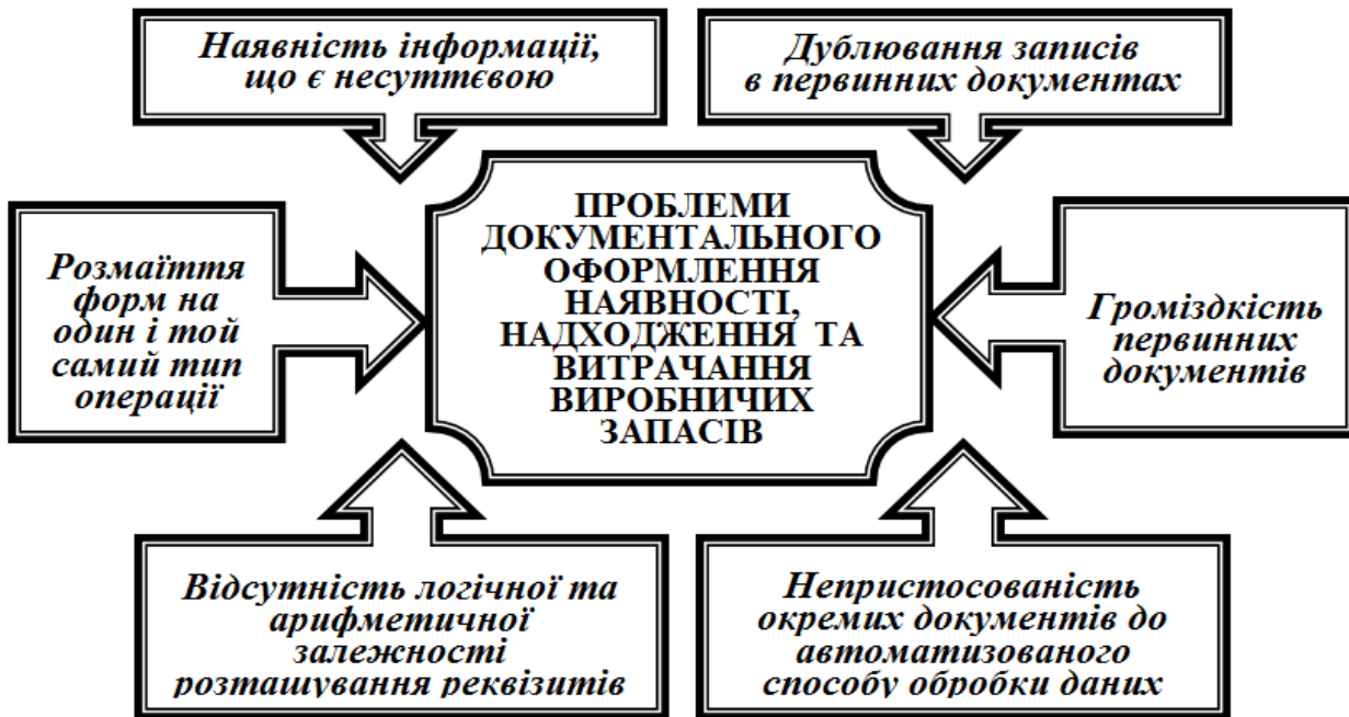
Рис. 4. Основні недоліки документального оформлення виробничих запасів

Безпосередньо отримані виробничі запаси оформлюються Прибутковим ордером (ф. М-4), який складається матеріально відповідальною особою в одному примірнику в день надходження цінностей на склад. Варто зазначити, що сьогодні серед науковців існують різні бачення щодо раціональності побудови Прибуткового ордера. Зокрема Борисовський М.І. зазначає, що "типова форма Прибуткового ордера містить реквізити, які сповільнюють його складання". Тому ним запропоновано виключити графу щодо проставлення підпису особи, яка здає матеріальні цінності, оскільки "за своєю суттю цей документ засвідчує факт оприбуткування матеріальних цінностей і без супровідних документів, на яких є підпис даної особи, він не має юридичної чи будь-якої іншої доказової сили" [7, с. 92]. Проте необхідно зазначити, що дана пропозиція не є коректною, оскільки графа щодо проставлення підпису особи, яка здає матеріальні цінності в першу чергу дає змогу ідентифікувати особу, яка брала участь у передачі матеріальних цінностей. Ще Борисовський М.І. пропонує у разі наявності на підприємстві декількох складських приміщень використовувати таку систему нумерації прибуткових ордерів, яка б забезпечила їх групування за місцями зберігання запасів, що сприятиме легшій обробці прибуткових ордерів у бухгалтерії та зменшить ймовірність крадіжок матеріальних цінностей на складах [7, с. 94].