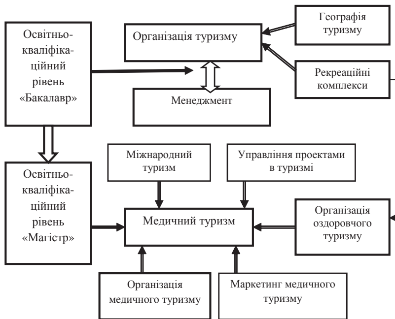
Рис. 2. Структурно-логічна схема теоретичної підготовки фахівців для сфери медичного туризму

Галузевий державний стандарт вищої освіти України з спеціальності 8.14010301 "Туризмознавство" передбачає вивчення навчальних дисциплін "Міжнародний туризм" та "Управління проектами в туризмі". В рамках вивчення цих навчальних дисциплін передбачаються окремі змі-