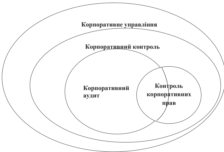
Рис. 1. Співвідношення понять "корпоративне управління", "корпоративний контроль", "корпоративний аудит" та "контроль корпоративних прав"