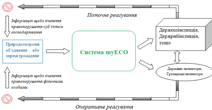
Рис. 3. Організація роботи електронної системи myECO за напрямом "оперативний контроль"

активом можливо як для обміну інформацією, так і для організації оперативного контролю, оскільки однією з її функцій є отримання, обробка та передача інформації від громадян до органу державного нагляду (контролю) (рис. 3).