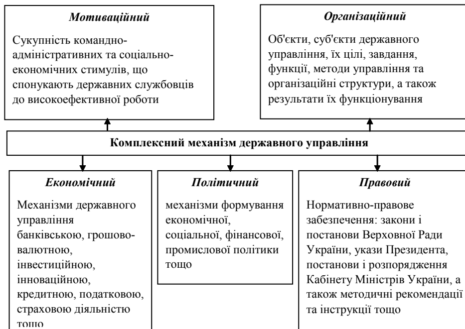
Рис. 2. Комплексний механізм державного управління

Зазначимо, що в управлінському процесі функції впливають на керований процес, які зумовлюють його результативність. Відтак вони є первинними, а методи вторинні, оскільки виступають як один із факторів ефективності управління. Під час аналізу функціонування механізму державного управління обов'язковим є врахування змістовної характеристики і визначення складу конкретних методів. Однак вони не можуть виступати як складові механізму управління, оскільки ні склад, ні специфіка дії механізму управління не визначаються методами, вони лише характеризують конкретний режим його функціонування. Крім того, методи державного управління передбачають відповідні засоби їх реалізації, тобто своєрідний інструментарій, набір конкретних і частіше усього матеріальних предметів, що використовуються в управлінському процесі, таких як: технічних, спеціальних, інформаційних, комунікативних тощо [10, с. 107].