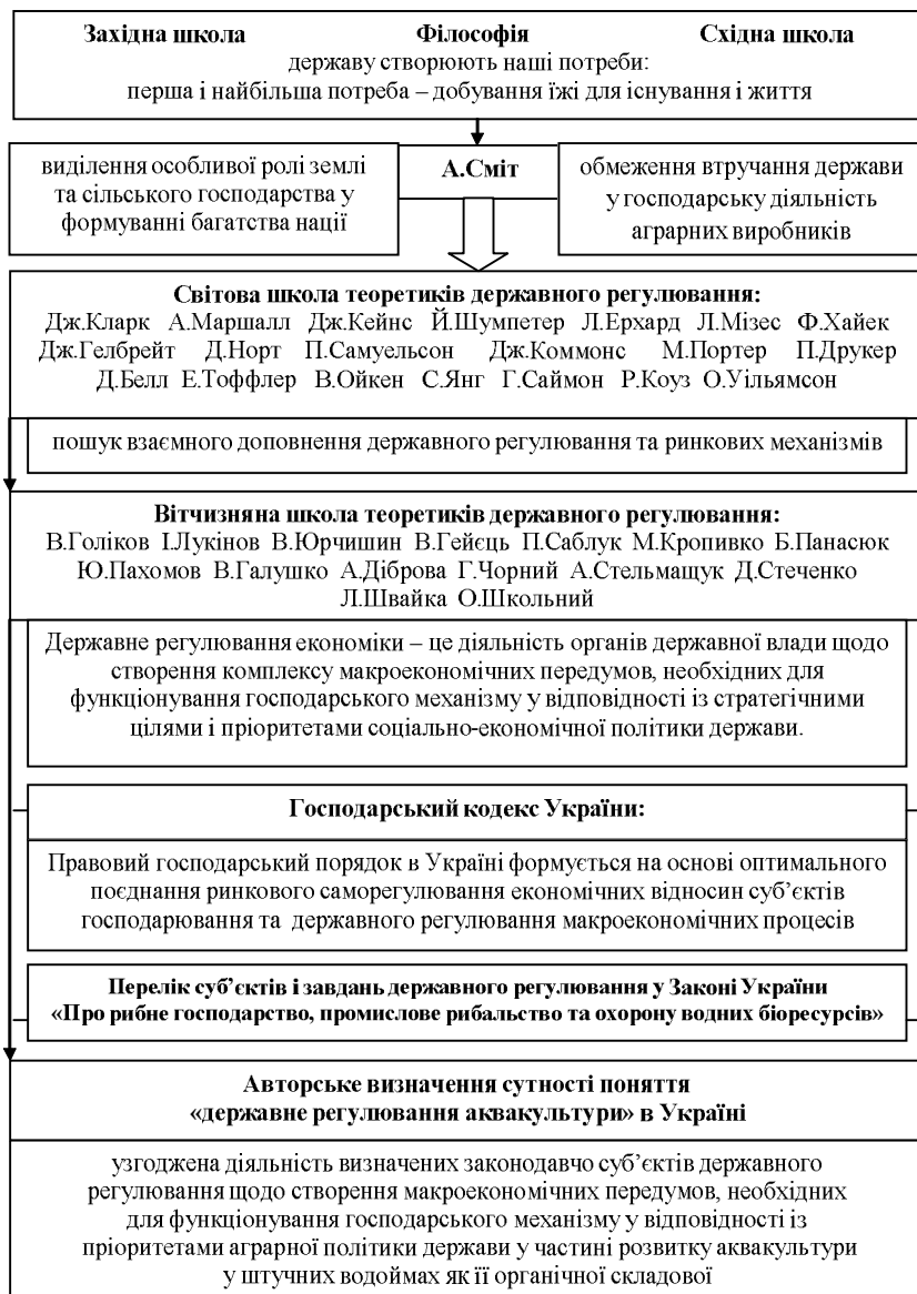
Рис. 2. Теоретичні засади формування системи державного регулювання розвитку аквакультури в Україні

яття / В.И. Голиков. — К.: Наукова думка, 1968.