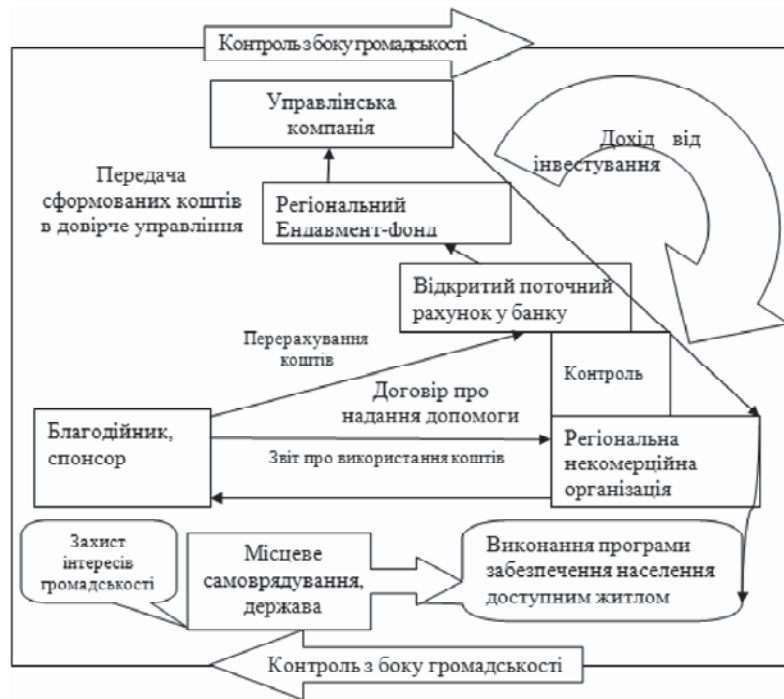
Рис. 1. Схема функціонування регіонального ендавмент-фонда забезпечення населення доступним житлом

Вищенаведені визначення засвідчують головні особливості функціонування ендавмент-фондів, можна сказати "грані вигоди":