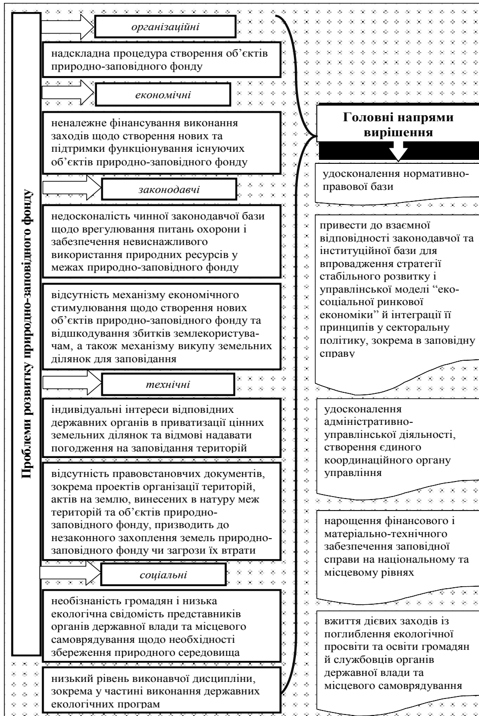
Рис. 3. Основні проблеми розвитку природно-заповідного фонду та напрями їх вирішення